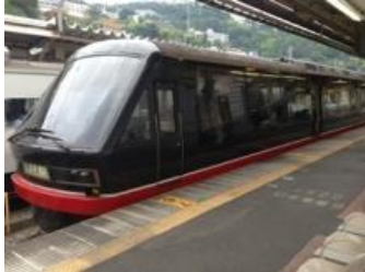
(リゾート21黒船電車)

鉄友会2のグループは、7月13日(日)に伊豆急行に乗り、伊豆高原まで行ってきました。伊豆急行リゾート21などに、乗って、見て、話して楽しむことができました。帰りはドルフィン号に乗って帰るグループと、温泉などでゆっくり帰るグループとに分かれ、それぞれの電車の旅を楽しみました。鉄友会1のグループは、12月に皆で出かける予定です。