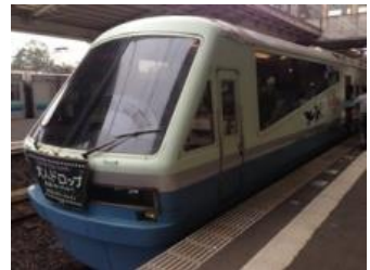
(リゾート21ドルフィン号)