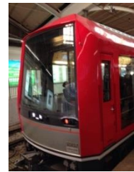
(箱根登山鉄道新型車両)